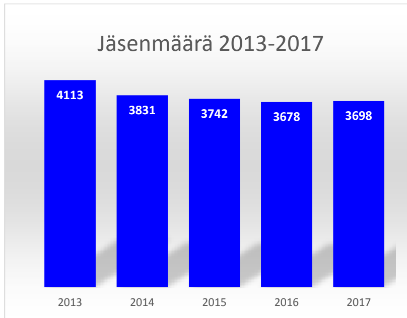
Kuvio 1. Suomen Valmentajien jäsenmäärän kehitys viimeisen 5 vuoden aikana.

Suomen Valmentajat ry:n jäsenmäärä 31.12.2017 oli 3698 jäsentä, joista yhteisöjäseniä 58. Jäsenmäärän kehitys on kääntynyt hienoiseen nousuun. Uusien liittyneiden jäsenten määrässä on hieman laskua, joten jäsenten pysyvyys on lisääntynyt. Maksamattomien osuus jäsenistöstä on kuitenkin hieman myös kasvanut. Yhteisöjäsenten määrä nousi 49:sta 58:aan.